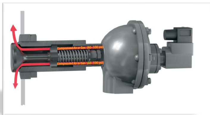
特許取得 特殊形状ノズル