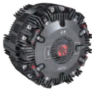
スリップクラッチ&ブレーキ Slip-clutch&brake