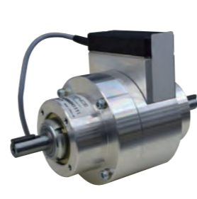
高精度クラッチ&ブレーキユニット High precision clutch&brake unit