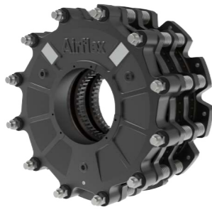
水冷ブレーキ Water cooled brake