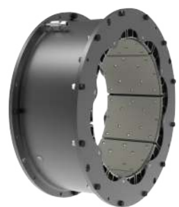
空圧式クラッチ&ブレーキ Pneumatic clutch&brake

We suggest wide variety of products from small to large, pneumatic, hydraulic, combination, drum, disk, and caliper. Our in-house engineering team will accommodate to your special specification.