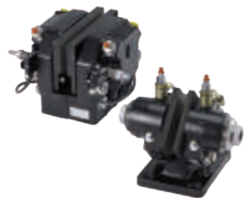
油圧式キャリパーブレーキ Hydraulic caliper brake