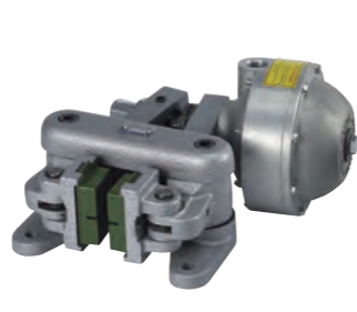
空圧式キャリパーブレーキ Pneumatic caliper brake