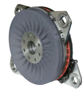
コンビネーション型クラッチ&ブレーキ Combination clutch&brake